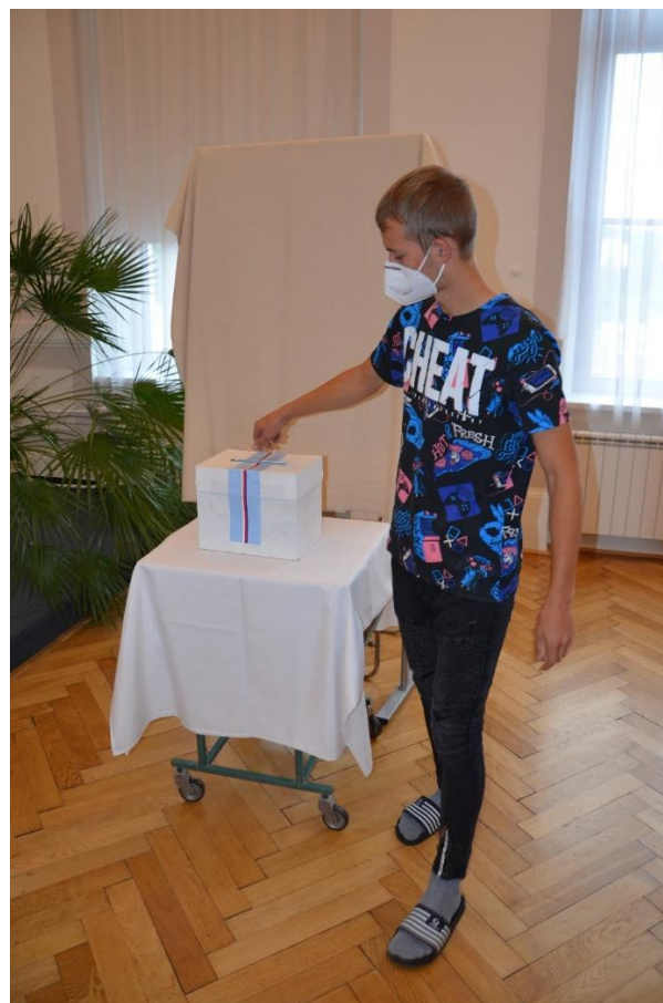
Studentské volby do Poslanecké sněmovny ČR na GVM.