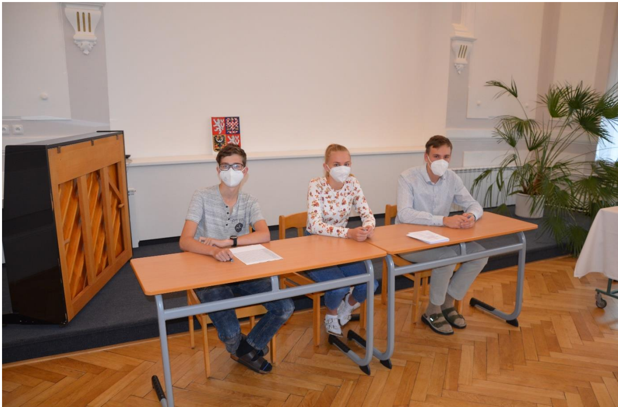
Členové volební komise na GVM.