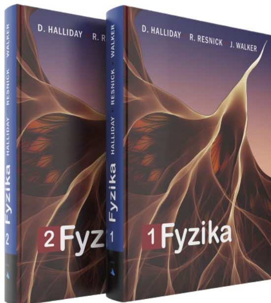
Obr. 1 Nové české vydání učebnice D. Halliday, R. Resnick, J. Walker: Fyzika .

V programu byly zařazeny přednášky s přesahem do filosofie, ale i vystoupení, která pojednávají o nových poznacích v našich oborech. Tradičně nechyběly ani přednášky či aktivity, které se týkají výuky matematiky a fyziky a obecně pedagogických otázek. Po slavnostním zahájení, které doplnilo vystoupení pěveckého sboru Gymnázia Velké Meziříčí, byly během tří dnů předneseny tyto příspěvky: E. Fuchs: Historie – inspirace pro současnost aneb též o stavu učitelů v čes-