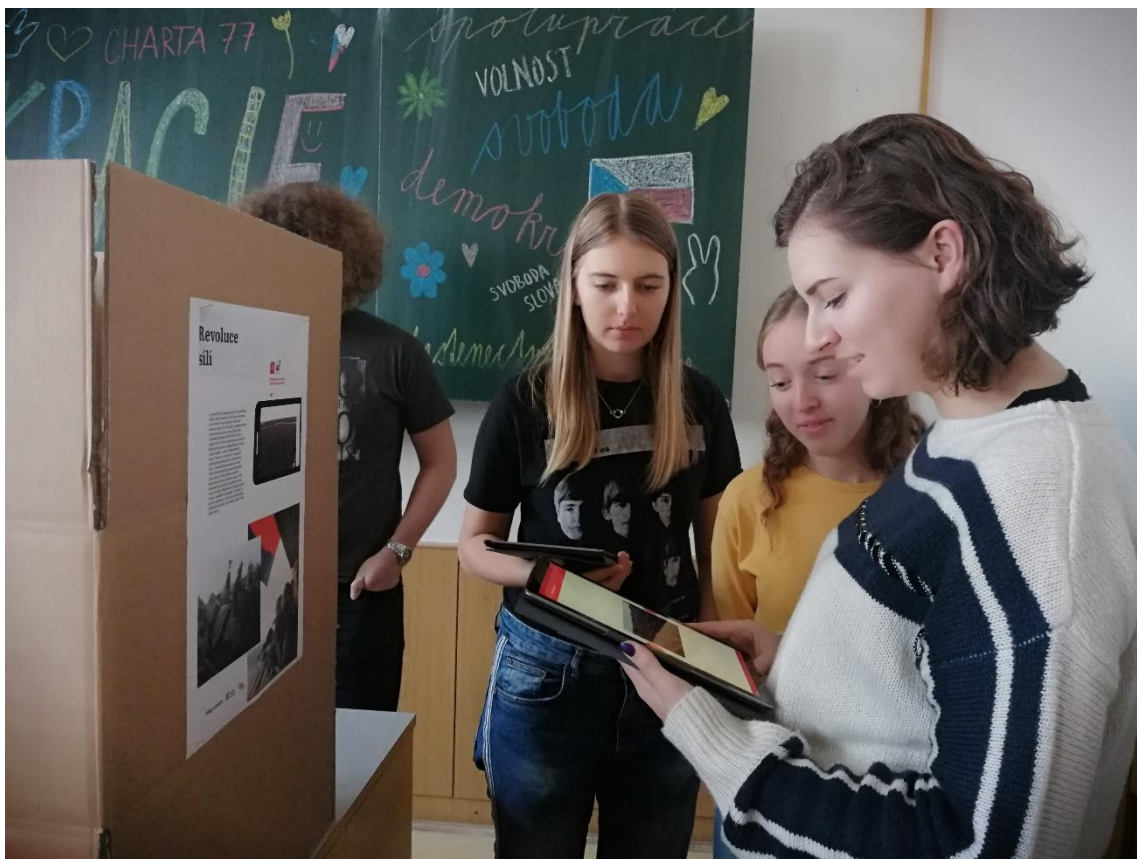
Obrázek 8: Interaktivní výstava Střípky revoluce v laboratoři fyziky