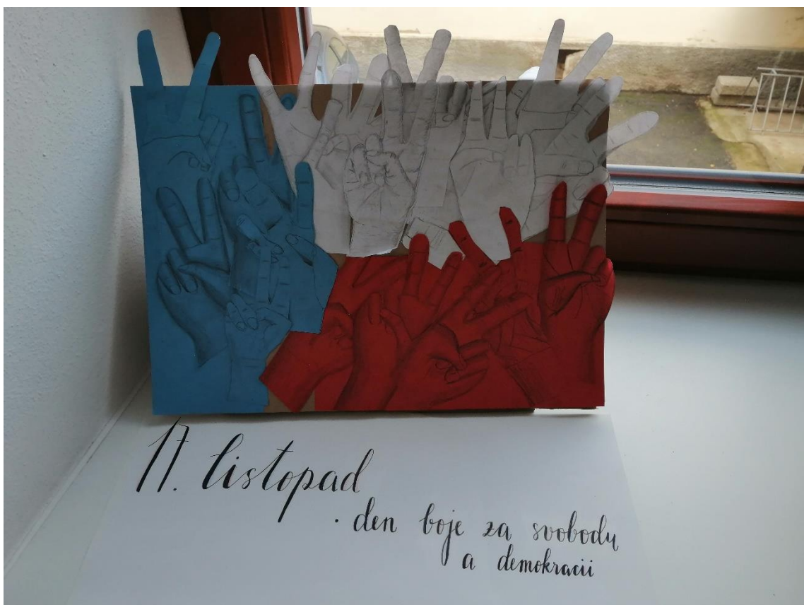
Obrázek 13: Výtvarné práce 6. A