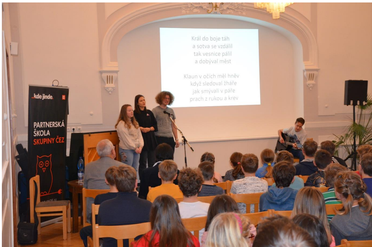
Obrázek 4: Pěvecké vystoupení v aule