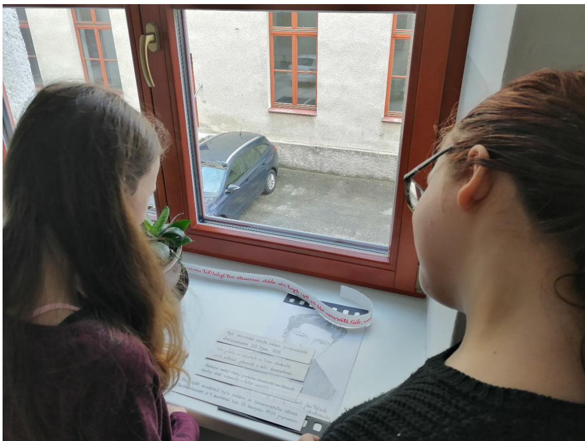
Obrázek 12: Výtvarné práce 6. A