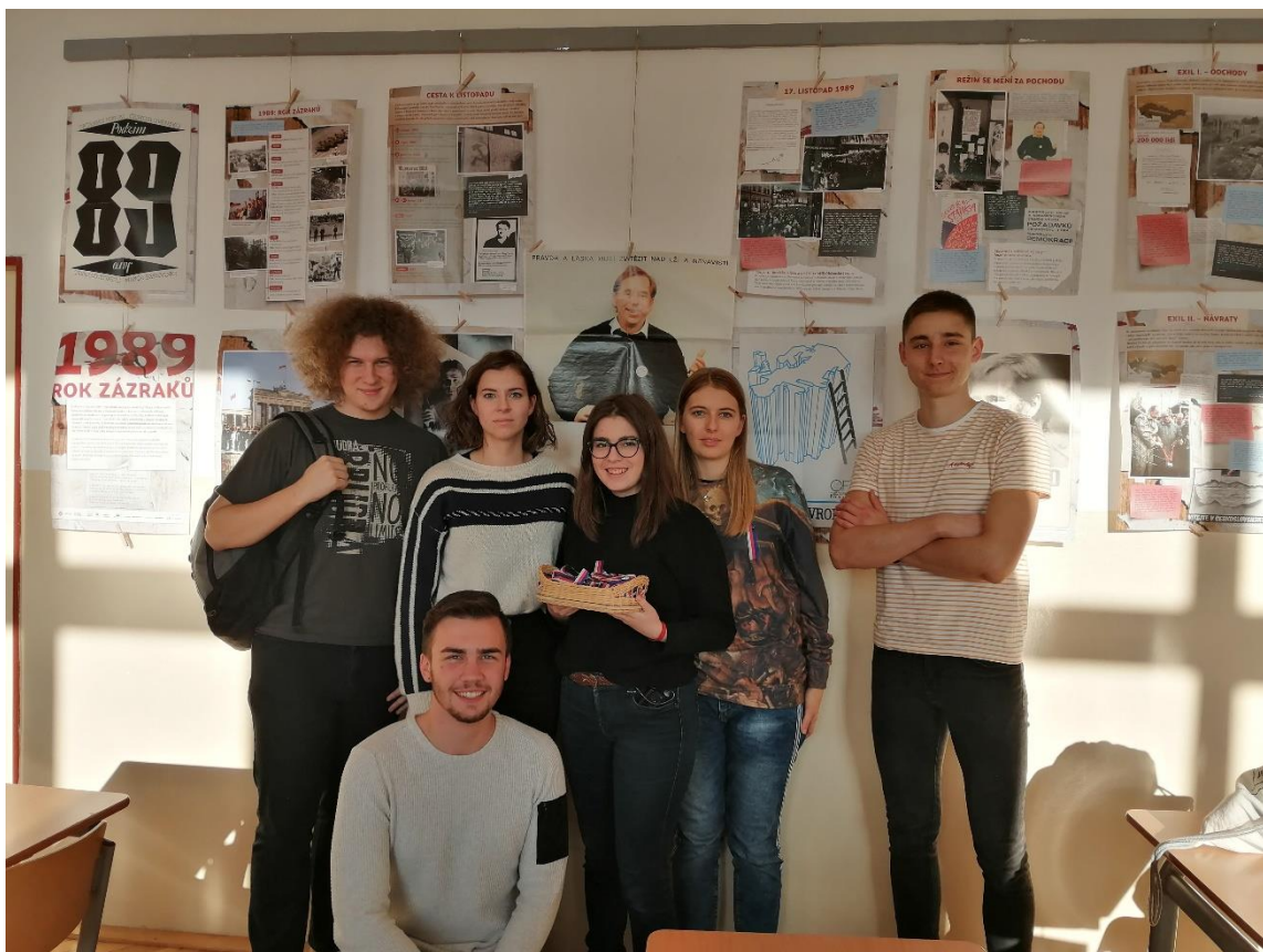
Obrázek 15: Výstava v učebně dějepisu a studenti chystající trikolóry na následující den