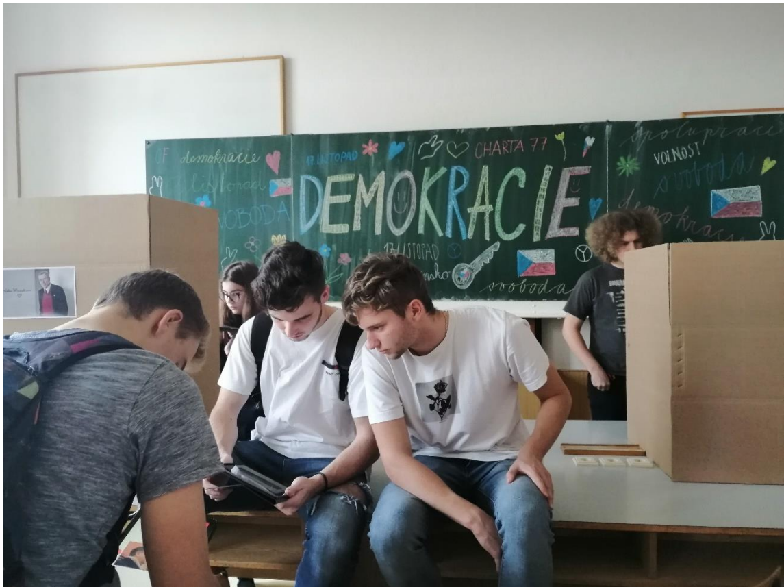
Obrázek 6: Interaktivní výstava Střípky revoluce v laboratoři fyziky