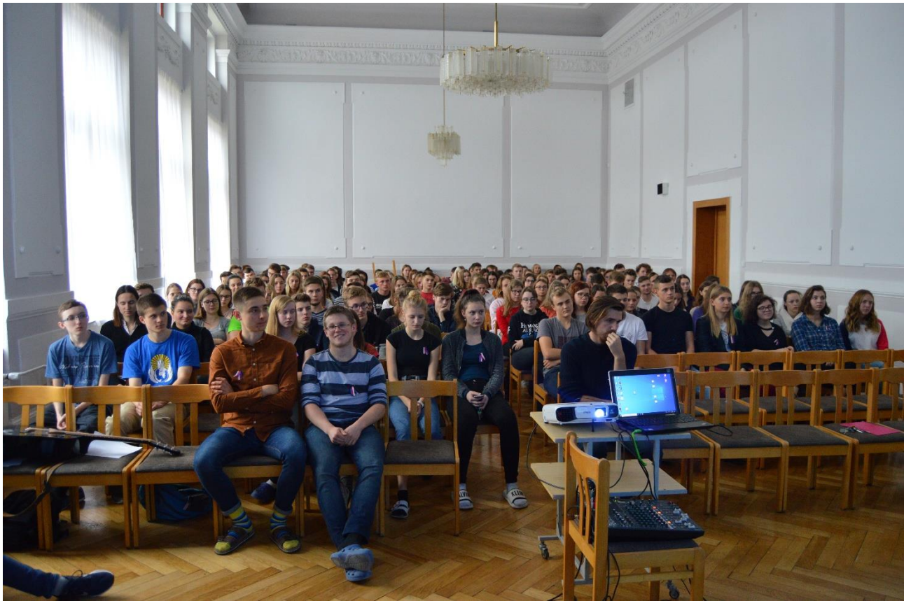
Obrázek 2: Studenti VG při promítání v aule GVM