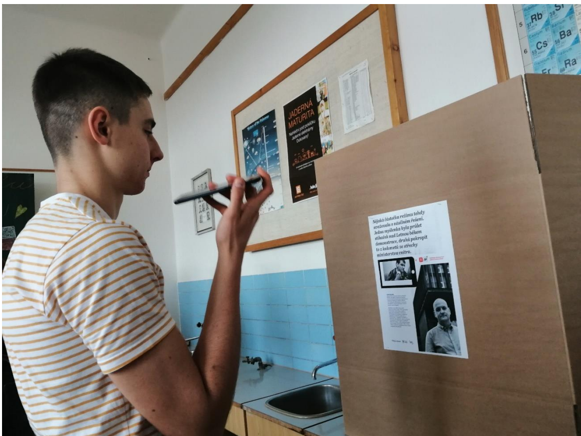
Obrázek 7: Interaktivní výstava Střípky revoluce v laboratoři fyziky