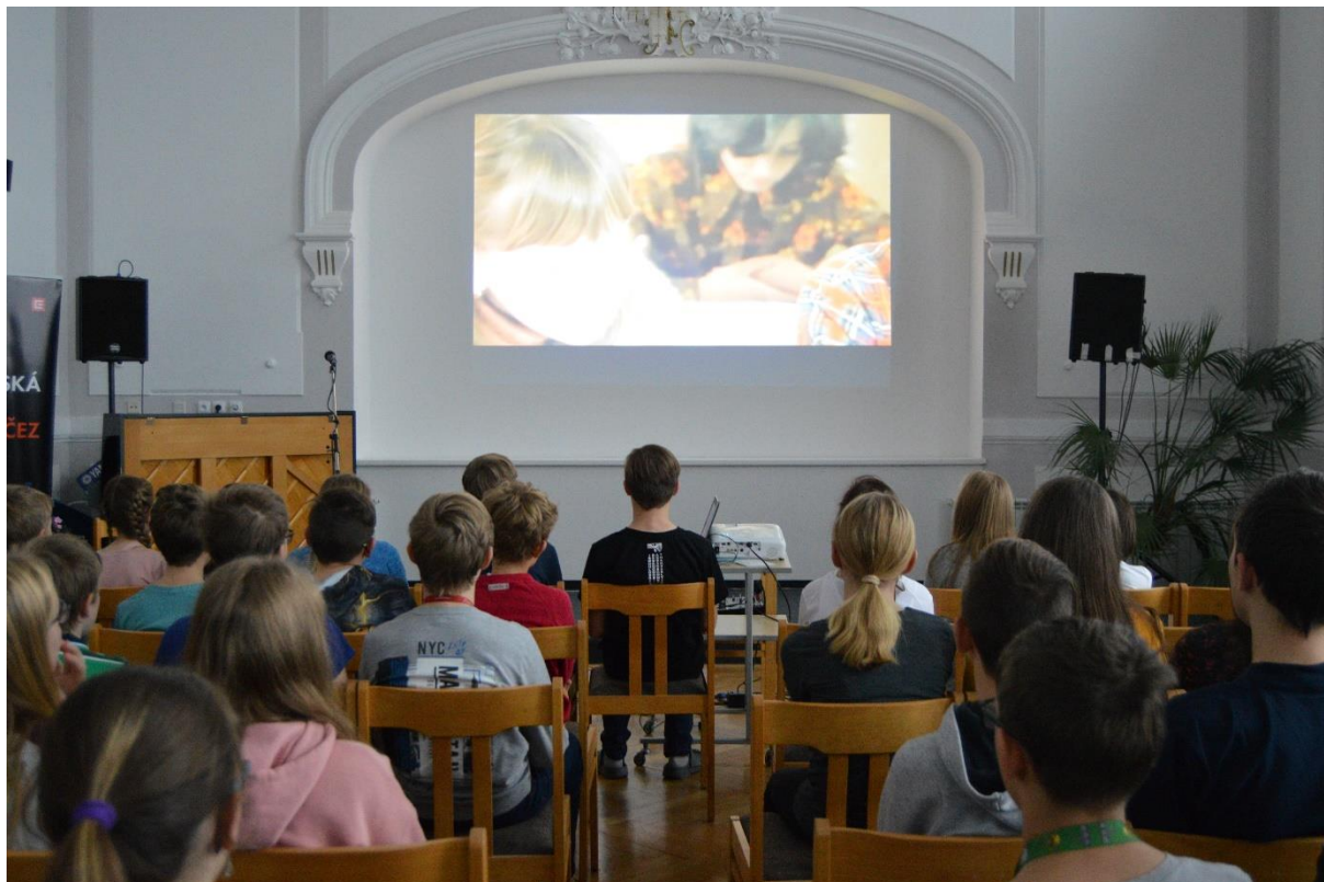
Obrázek 1: Studenti NG a 1. ročníků při promítání v aule GVM