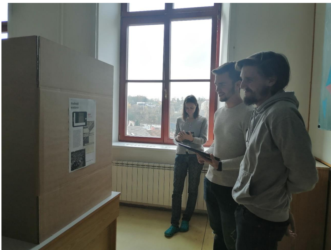
Obrázek 9: Interaktivní výstava Střípky revoluce v laboratoři fyziky