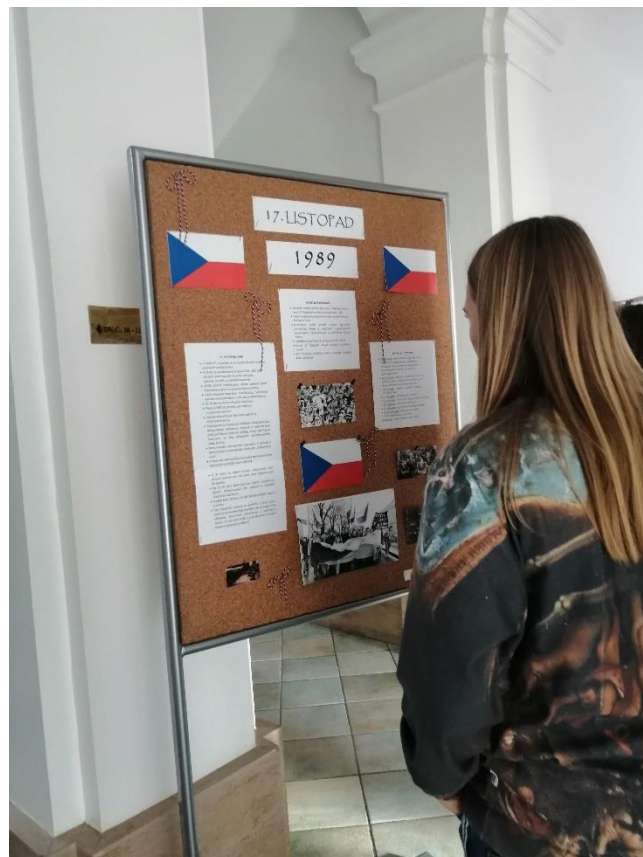
Obrázek 11: Chodba v přízemí