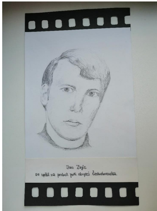
Obrázek 14: Výtvarné práce 6. A