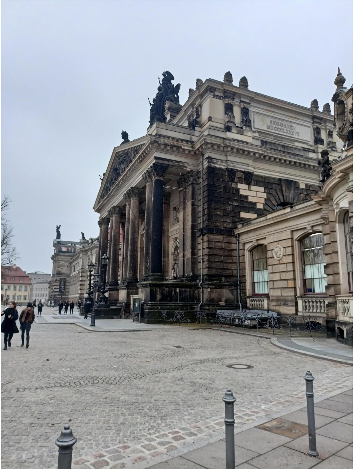
Obrázek 4: die Semperoper