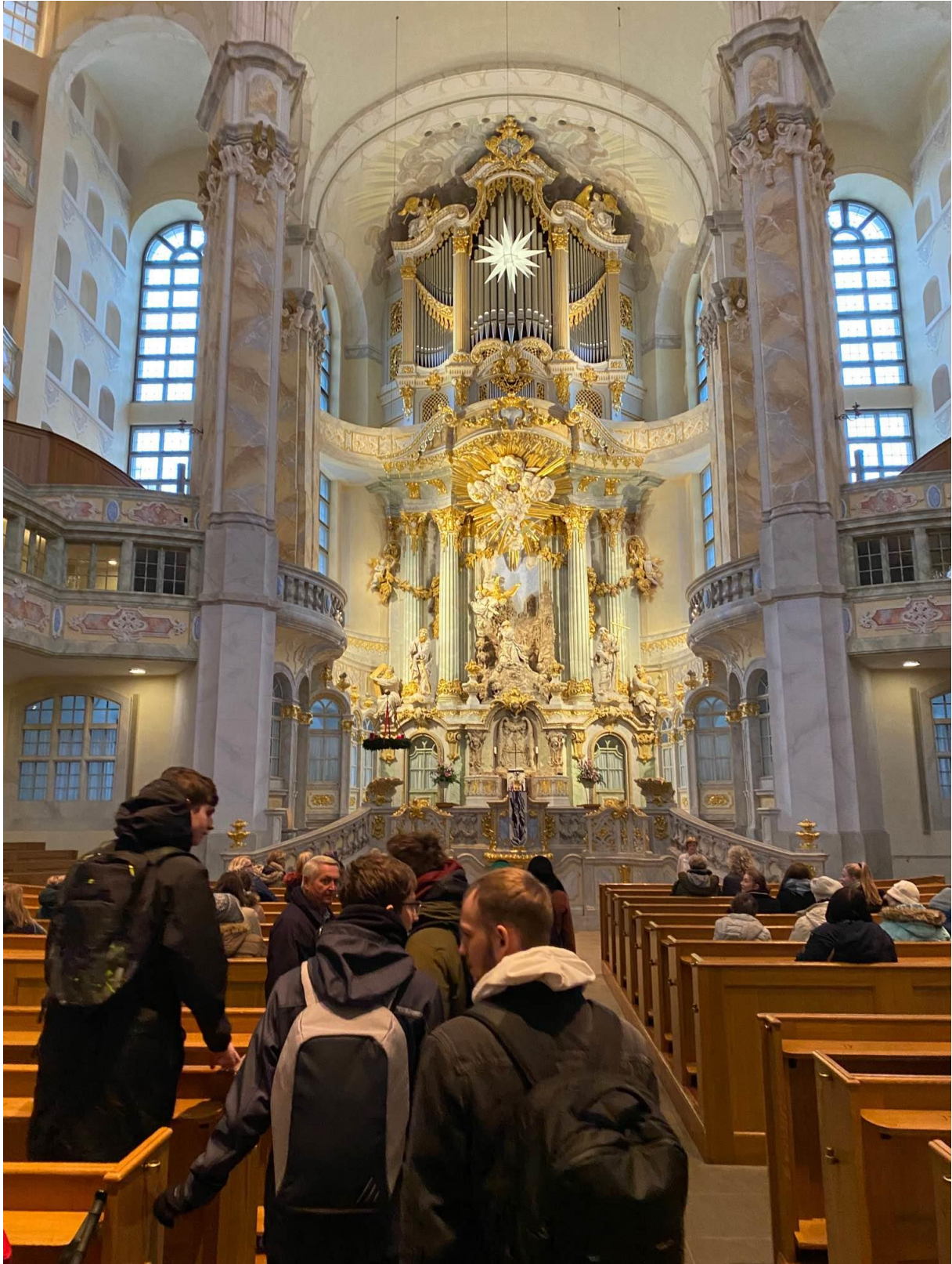
Obrázek 6: die Frauenkirche