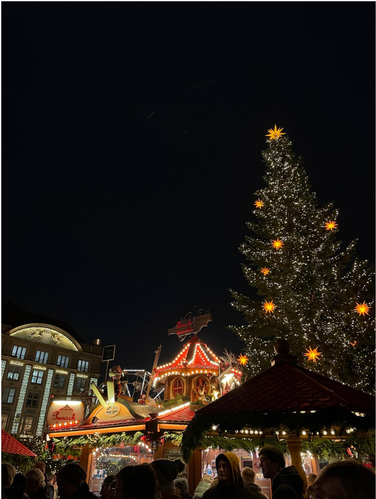
Obrázek 8: Striezelmarkt (vánoční trh v Drážďanech)