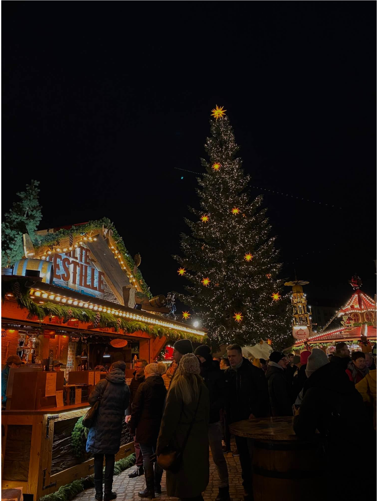
Obrázek 9: Striezelmarkt (vánoční trh v Drážďanech)