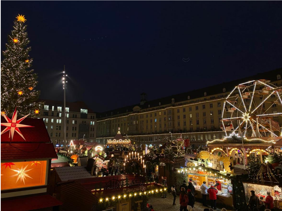
Obrázek 10: Striezelmarkt (vánoční trh v Drážďanech)