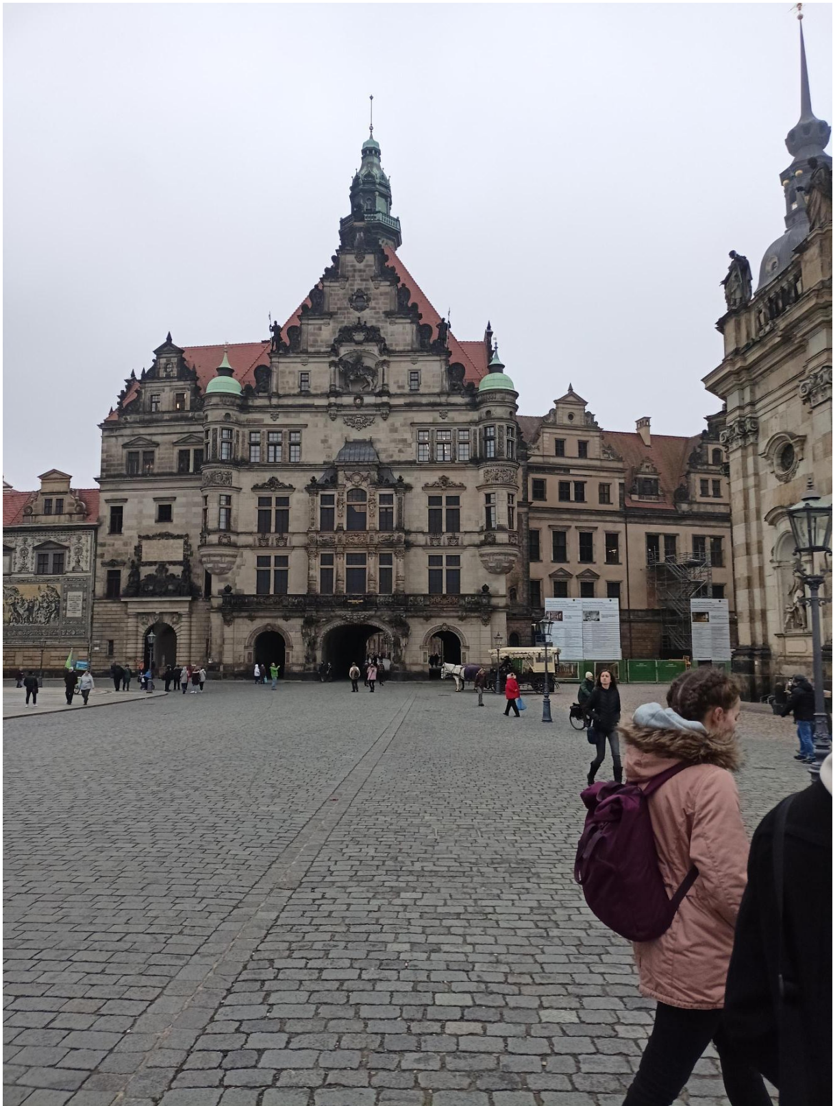
Obrázek 5: das Residenzschloss