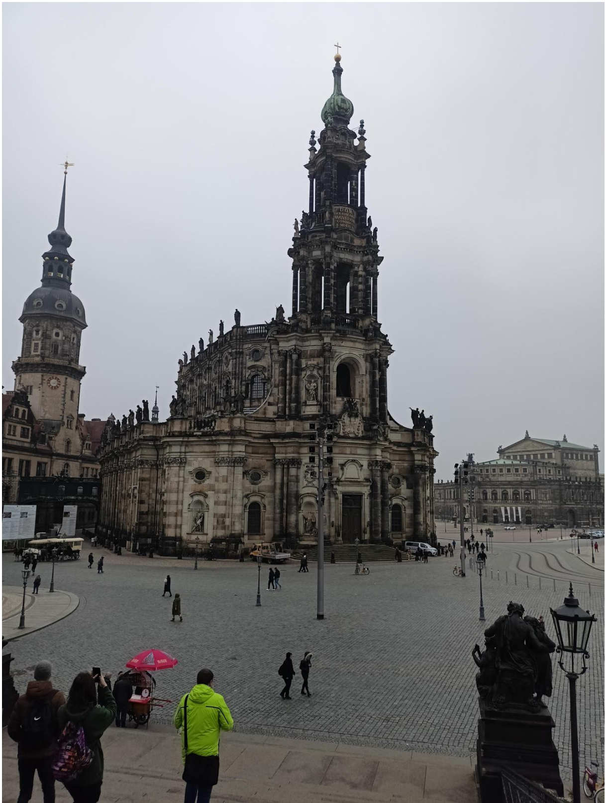
Obrázek 3: Drážďany jsou nazývány Florencií na Labi, die Hofkirche