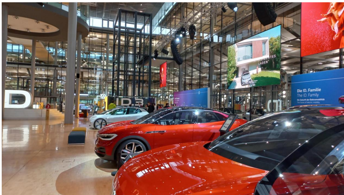
Obrázek 1: Prohlídka výroby eVW Golf