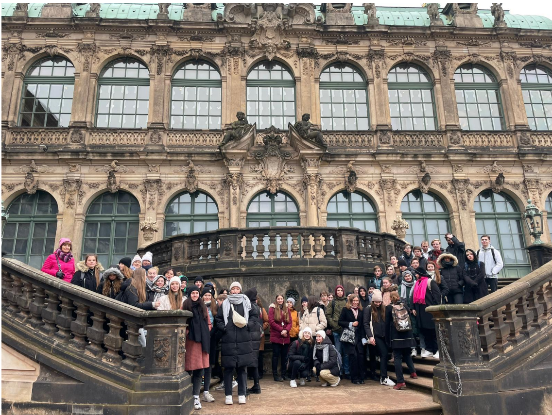
Obrázek 11: Exkurzi jsme si moc užili ...