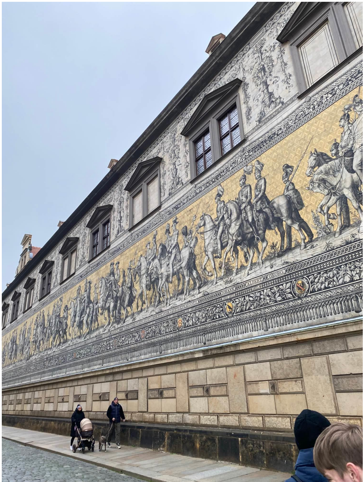
Obrázek 7: der Fürstenzug