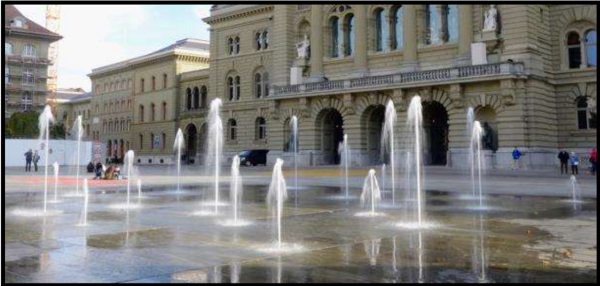
26 fontán v Bernu

Podle legendy nese toto město název podle medvěda (německy Bär). Takže naše prohlídka nemohla začínat nikde jinde, než právě u výběhu medvědů. Odtud jsme pokračovali do centra. Viděli jsme bernské kašny včetně té, která nese název Pojídač dětí, dále jsme míjeli Einsteinův dům, místní orloj ... Naposledy jsme zamávali Švýcarsku a vydali se přes noční Německo směrem domů.