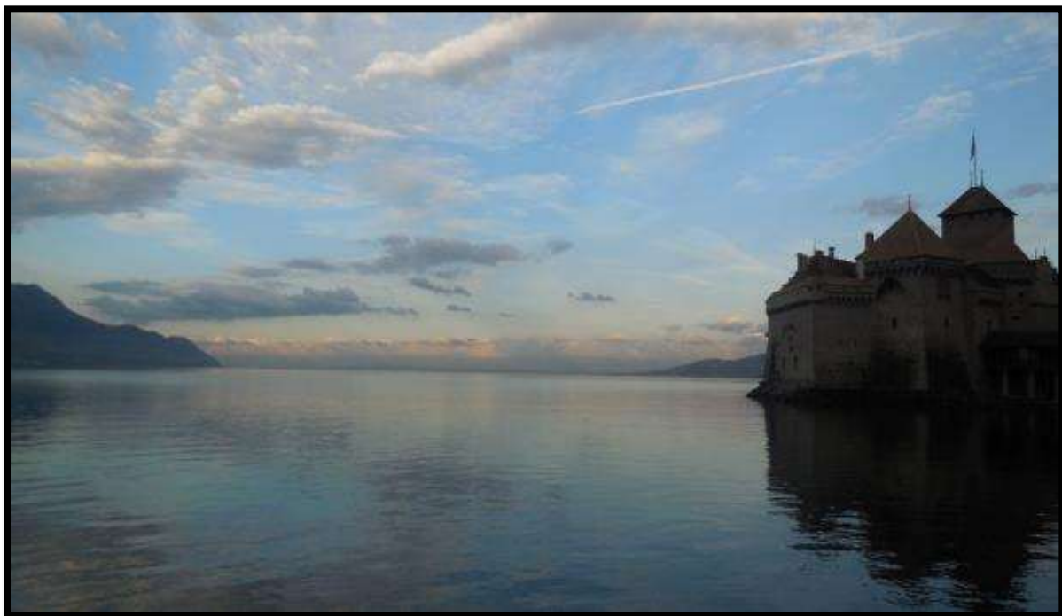
Vodní hrad Chillon

Pátek začal výbornou snídaní formou švédských stolů a s obědovými balíčky jsme se vydali za dalším dobrodružstvím. Naší první zastávkou se stal vodní hrad Chillon. Dovnitř jsme sice nešli, ale stavba nás i zvenčí velmi zaujala. Chillon obklopen Ženevským jezerem a k tomu ještě východ slunce, to byla přímo dech beroucí podívaná.