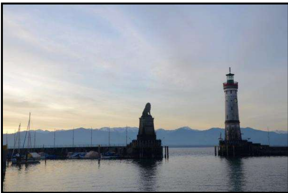
Brána do přístavu v Lindau

V ranních hodinách jsme dorazili k naší první zastávce, k nádhernému německému městu Lindau. Vyskákali jsme z autobusu a vydali se na ranní procházku městem, která vedla převážně podél Bodamského jezera. Obdivovali jsme krásy Staré radnice, Mangturmu či místního přístavu. Poté jsme směřovali ke švýcarskému Winterthuru, neboť naším cílem byla návštěva tamního science centra –Technoramy.