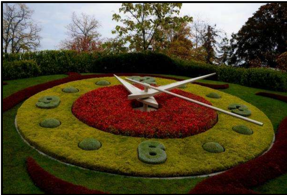
Květinové hodiny v Ženevě

Další část dne jsme strávili v Ženevě, v neoficiálním středisku francouzsky mluvící oblasti Švýcarska. Prohlídka města začínala u pomníku na nábřeží, který stojí na místě, kde byla zavražděna rakouská císařovna Alžběta („Sisi“). Poté jsme volnou chůzí pokračovali ke květinovým hodinám.