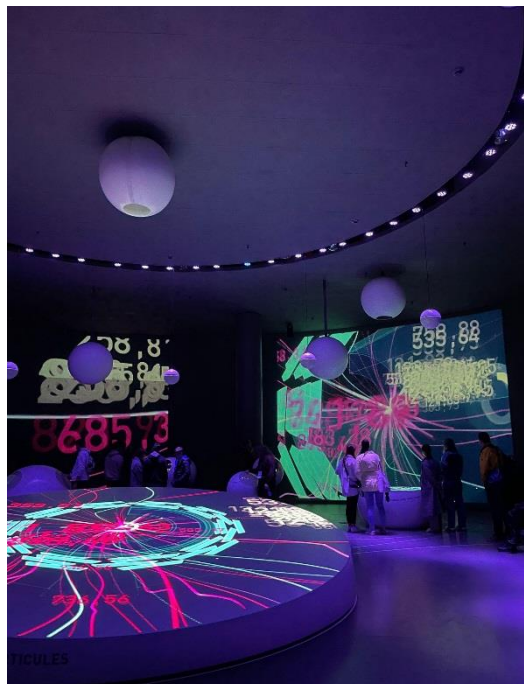
Nahoře: nejdražší burger u urychlovače Dole: Glóbus vědy a inovací, CERN