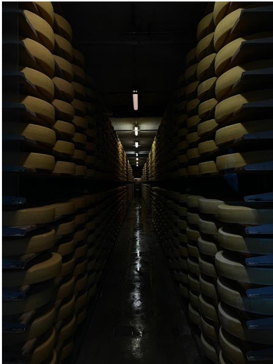
Sklad sýrárny Gruyère

Po dosažení našeho cíle a rozloučení se s naší paní průvodkyní Hedou a pány řidiči jsme se konečně odebrali domů, abychom konečně sdělili všechny naše zážitky a dojmy a mohli se podělit o ty fotky a dobroty, které jsme nahromadili.