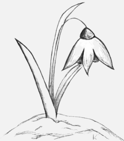
Ilustrace: Karolína Ribárová

Nalej si čistého vína Nejčirejší vody Nejkvalitnějšího rumu Kravského mléka A rozdrčených žeber z norka Napij se vlastního žalu A cizího neštěstí Napoj se krví svých nepřátel Ať poznáš Že není nic krásnějšího na světě Než zmrzlá jarní sněženka