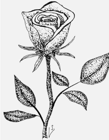
Ilustrace: Ludmila Svobodová

Růže ty padají stále na moji hrud' i čelo. Každý, kdo prošel kolem, zhrozil se: „Jak dlouho tlelo tam její tělo?“