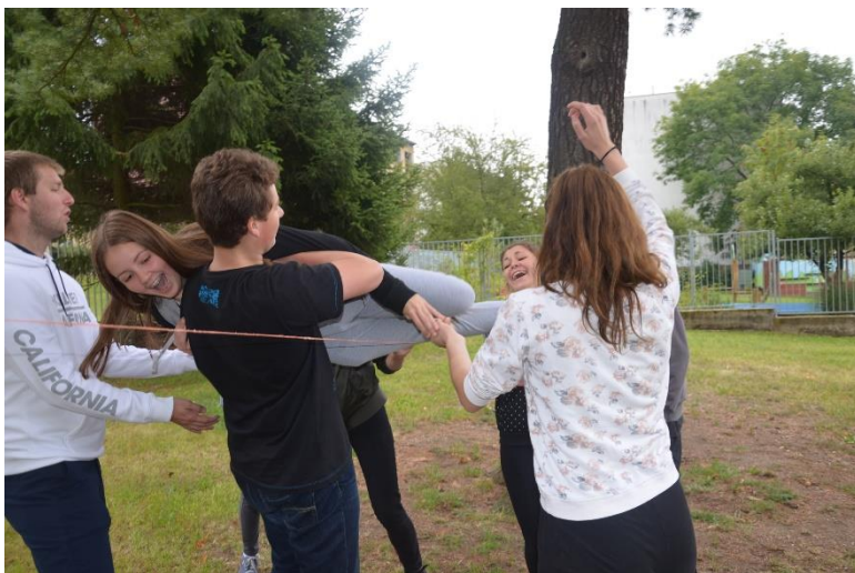
Žáci 1. C při adaptačním dopoledni.

Dalšímu vzdělávání pedagogických pracovníků (DVVP) věnujeme pozornost, neboť přispívá ke zkvalitnění výuky a práce se žáky. Při sestavování plánu se přihlíží k potřebě DVVP, aktuální nabídce a také k efektivnímu využití finančních prostředků, které jsou na DVVP vynaloženy. Skutečnost se oproti plánu může mírně lišit. Podporujeme nejrůznější formy: doktorské studium, semináře a školení k nové maturitě, krátkodobé kurzy z různých předmětů apod. Další vzdělávací aktivity jsou realizovány v rámci grantu Šablony 2017 na GVM a prostřednictvím krajského projektu Učíme se ze života pro život. Vedení školy sestavuje plán DVPP a vede přehled všech kurzů absolvovaných jednotlivými učiteli. Tyto materiály jsou uloženy na ředitelství školy.