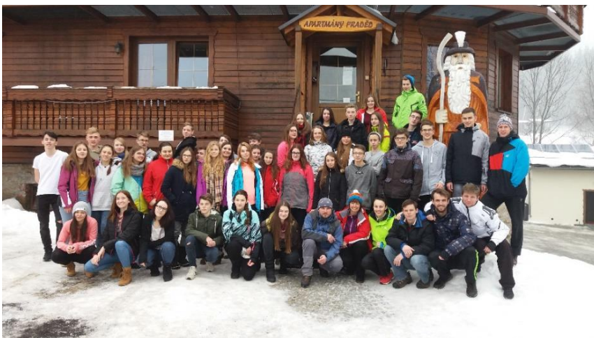
Z lyžařského kurzu tříd 5. A a 1. C v Karlově pod Pradědem.

V okresních kolech se na stupně vítězů dostalo družstvo fotbalistů kategorie IV. (3. místo), družstvo florbalistek kategorie V (3. místo) a družstva běžců soutěžící v přespolním běhu v kategorii III (3. místo) i kategorii VI (3. místo).