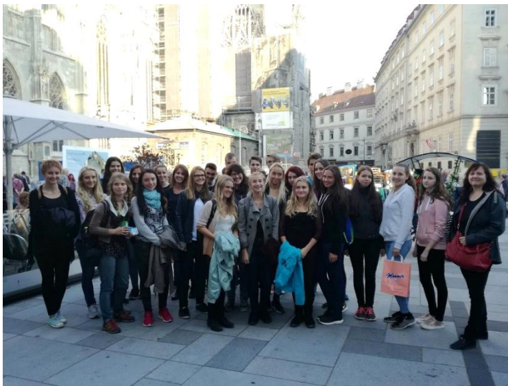
Fotografie z Vídně.