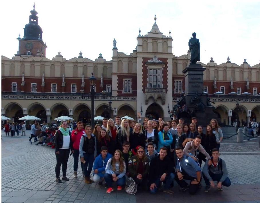
Žáci 8. A a 4. C na Královském rynku (Rynek Główny).