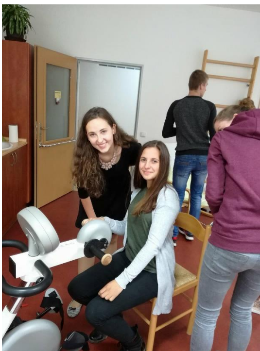
Žáci při návštěvě stacionáře NES.

S tím, jakým způsobem mohou klienti při pobytu ve stacionáři pracovat, seznamují v jednotlivých místnostech veřejnost milí a usměvaví zaměstnanci. Při interaktivní prohlídce v podzimně vyzdobeném a útulném prostředí je hostům také poskytnuta příležitost, aby si sami spoustu aktivit a činností vyzkoušeli. Na vlastní kůži se tak mohou přesvědčit o jejich náročnosti a o to více obdivovat umně zhotovené výrobky některých uživatelů. Děkujeme vstřícným a ochotným pracovníkům stacionáře za pozvání a především za náročnou práci, díky níž usnadňují nelehkou životní situaci klientům a jejich rodinám.