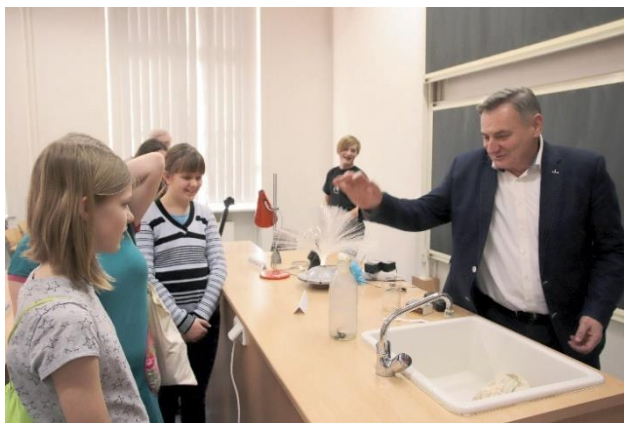
Odpoledne otevřených dveří v učebně fyziky.

Dopolední výuka téhož dne byla rovněž atypická. Studenti obdrželi svá vysvědčení a pak se také dle svých osobních preferencí přihlásili bez ohledu na věk do předmětů, v nichž 3 vyučovací hodiny pracovali na projektových aktivitách. U cizojazyčných předmětů si studenti vyzkoušeli připravovat anglické i německé pochoutky, matematici pojali učivo formou hry, dějepisci propojovali linii let 1348 – 1918 – 1938 – 1948 – 1968, dobrovolníci ze společenskovedního semináře navštívili zařízení NESÁ, kde se věnovali tamním klientům.