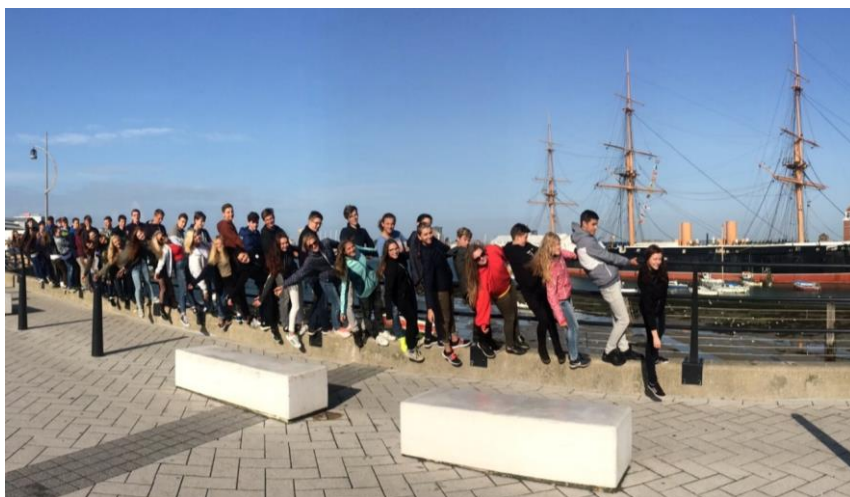
Před lodí Jejího Veličenstva.