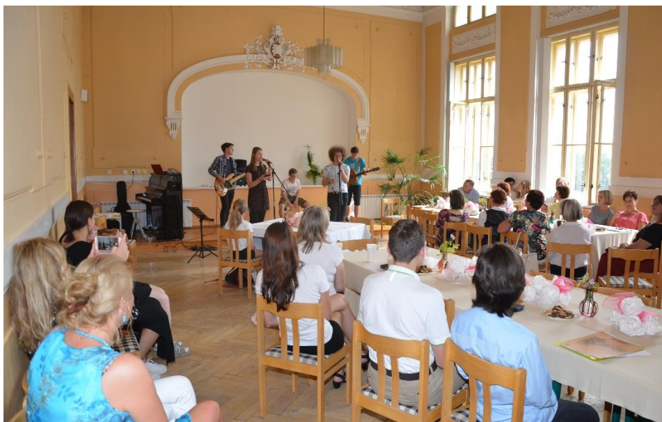
Poetická kavárna 2018.