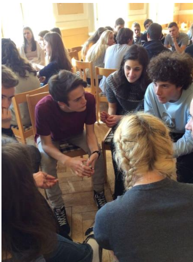
Diskuze mezi studenty v aule GVM.

Výměnný pobyt se uskutečnil za podpory města Velké Meziříčí a Sdružení rodičů při Gymnáziu ve Velkém Meziříčí, z. s. Těmto organizacím patří naše poděkování.