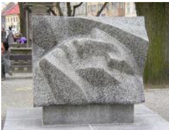
Památník zastřeleným v poslední dny války ve Velkém Meziříčí.