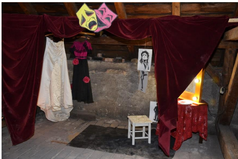
Z výstavy maturitních prací na půdě GVM.