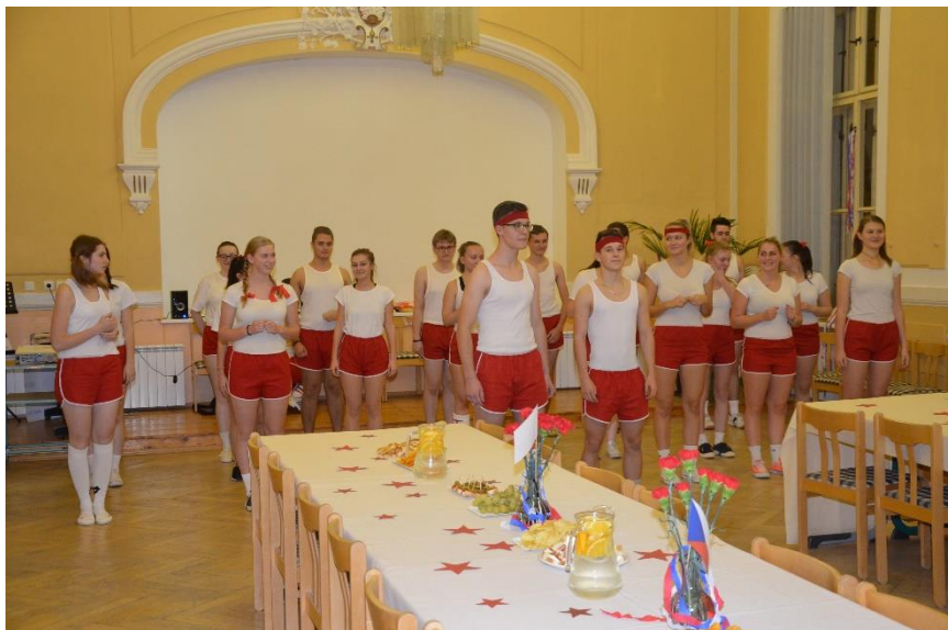
Začátek stužkovacího večírku 8. A.