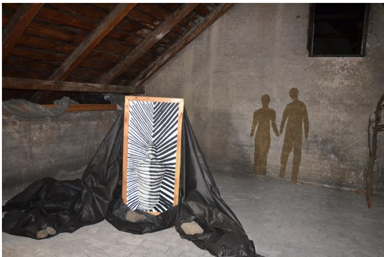
Z výstavy maturitních prací na půdě GVM.

Prevence sociálně patologických jevů vychází z Minimálního preventivního programu , který je sestavován pro daný školní rok. Ten obsahuje zvolenou strategii a postup při prevenci u žáků naší školy. Základním principem je výchova ke zdravému životnímu stylu, výchova k osvojení si vhodného sociálního chování a vedení k zodpovědnému jednání každého žáka. V Minimálním preventivním programu jsou uvedeny nejen jednotlivé kroky, ale i konkrétní aktivity (přednášky, besedy, sportovní akce apod.), které jsou v daném školním roce realizovány.