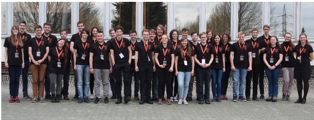
Účastníci Jaderné maturity.

Poslední den jsme vyplňovali závěrečný test, který prověřil naše nově nabyté znalosti a diskutovali jsme o budoucnosti získávání energie a dalším směřování Jaderné elektrárny Dukovany.