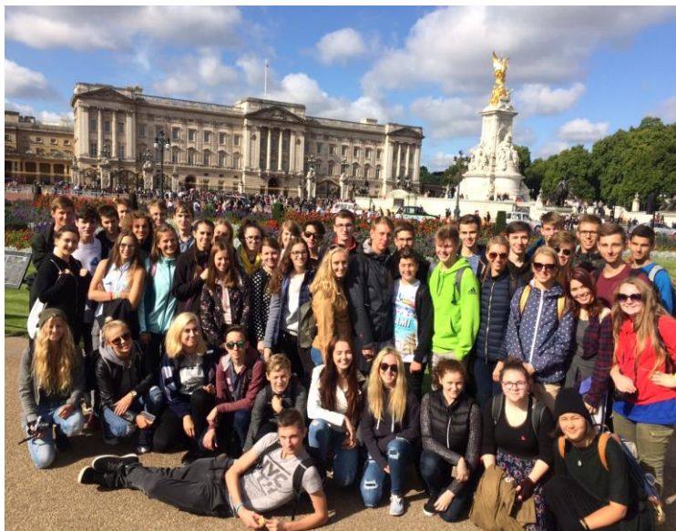
Účastníci zájezdu před „Buckinghame Palace”.