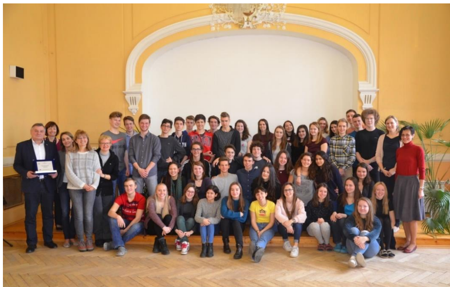
Společná fotografie v aule gymnázia.