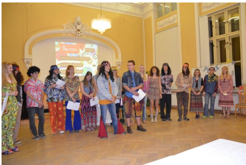
Stužkovací večírek 4. C.