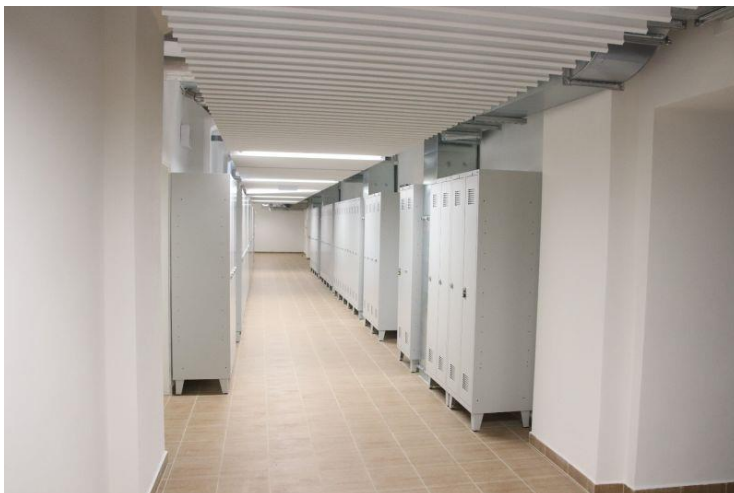
Pohled na nové šatny.

Oslava výročí založení gymnázia proběhne v první polovině června 2019.