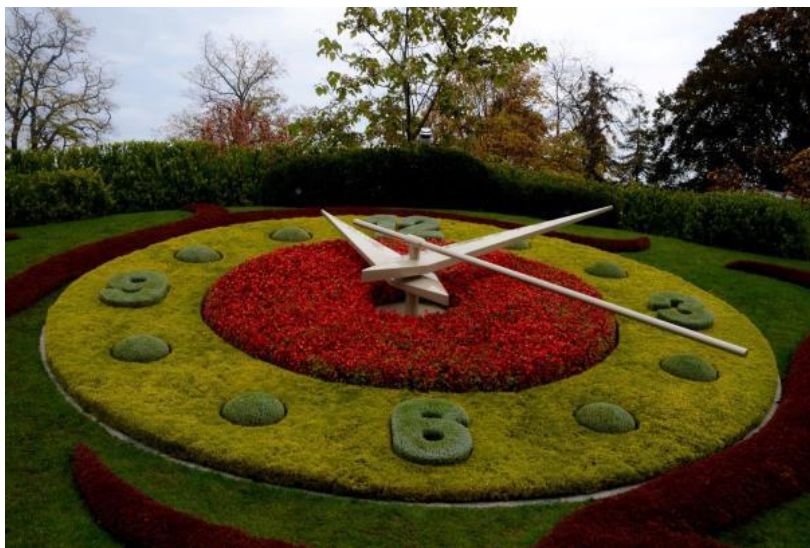
Květinové hodiny v Ženevě.

Další část dne jsme strávili v Ženevě, v neoficiálním středisku francouzsky mluvící oblasti Švýcarska. Prohlídka města začínala u pomníku na nábřeží, který stojí na místě, kde byla zavražděna rakouská císařovna Alžběta („Sisi“). Poté jsme volnou chůzí pokračovali ke květinovým hodinám.