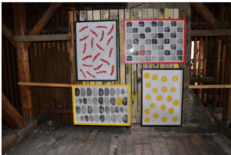
Z výstavy maturitních prací na půdě GVM.

Po rozeslání rozhodnutí o přijetí (nepřijetí žáků), po odevzdání zápisových lístků, po odvolání některých rodičů a po vyhovění některým žádostem formou autoremedury bylo přijato 30 uchazečů.