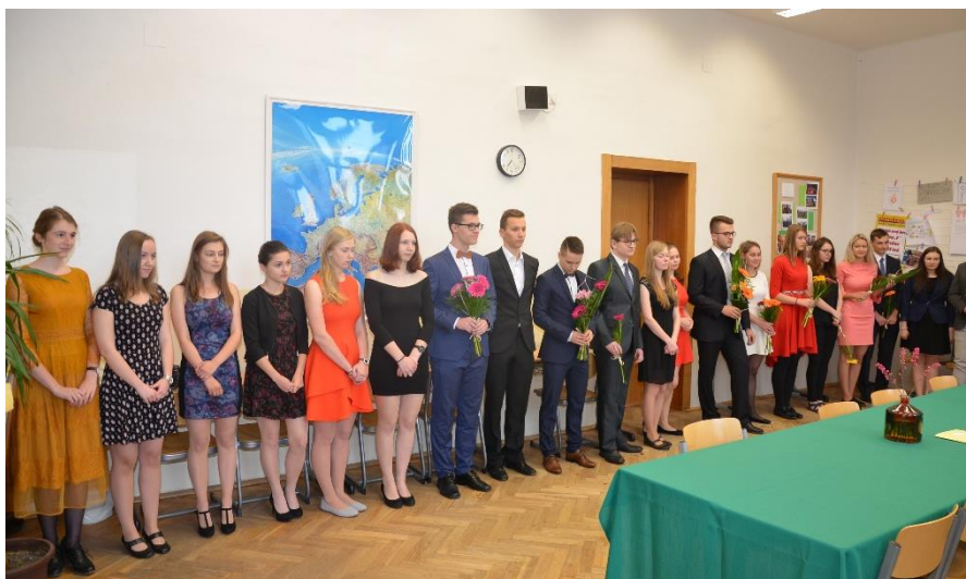
Maturitní třída 8. A.