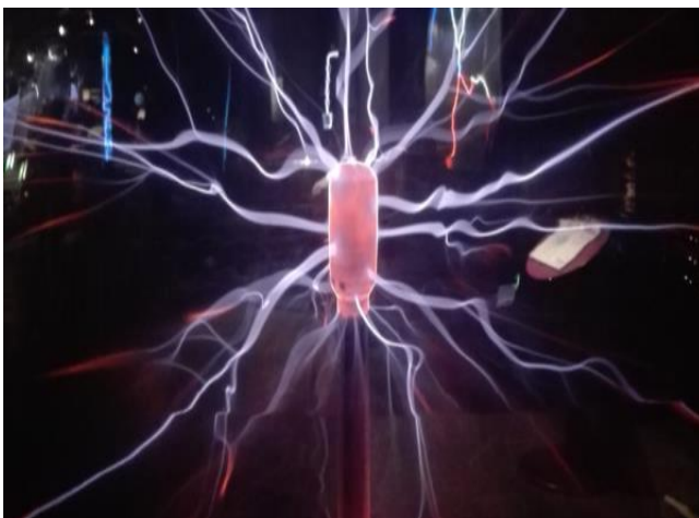
Elektrické výboje v Technoramě.

Na místo jsme přijeli v poledne. V Technoramě jsme strávili 5 hodin, ale myslím, že se nikdo ani chvíli nenudil. Tři patra nabitá informacemi a interaktivními fyzikálními pokusy by nás klidně zabavila na celý den. V rámci prohlídky jsme si vyslechli také několik zajímavých přednášek s fyzikální, chemickou či biologickou tematikou. Všechny byly prezentované buď v angličtině, nebo v němčině.