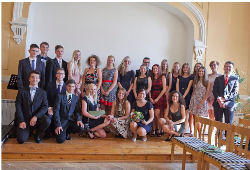
Maturitní třída 4. C.