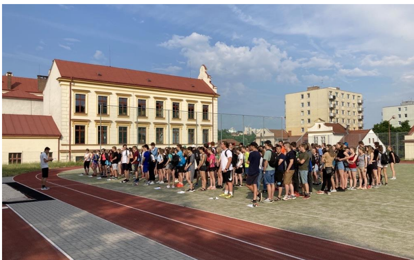
Nástup žáků na sportovní den v červnu 2021.