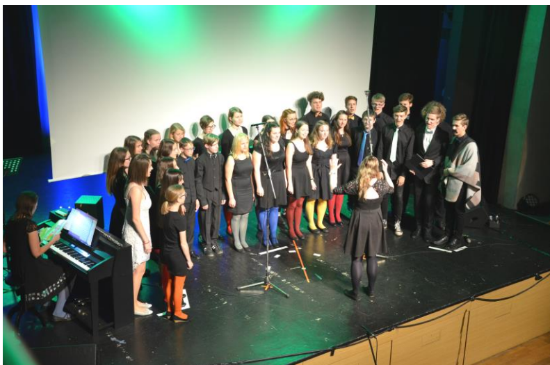
Pěvecký sbor GVM při vystoupení na slavnostní akademii při 120. výročí založení školy v červnu 2019.