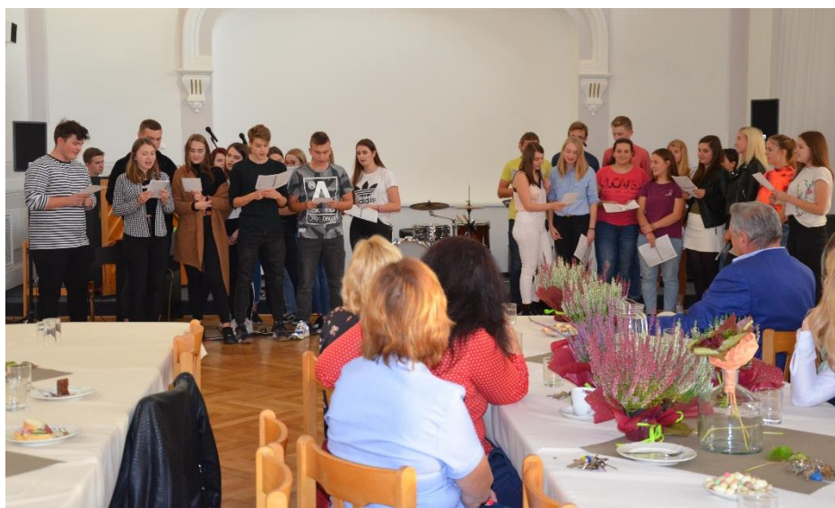
Společné vystoupení polských a českých studentů na závěrečném večírku.