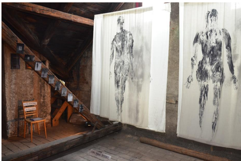
Z výstavy maturitních prací na půdě GVM.