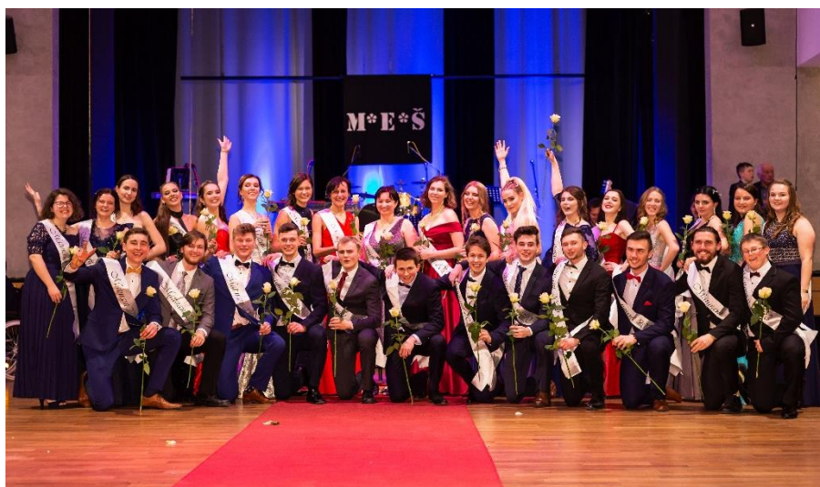
Třída 8. A na maturitním plese.

S textem poslední písně našeho „tance“ si opět uvědomím, jak trefný je její výběr: we are family, jsme rodina, přesněji spíše taková patchwork rodina. Byť na první pohled dosti rozdílní, skvěle se doplňujeme a dohromady tvoříme neprůstřelný tým. Na jednu stranu mě mrzí, že už je to za námi, na druhou stranu jsem nesmírně šťastná, že jsme to zvládli. Přestože to byl asi nejkratší den mého života, jsem si jistá, že na něj nikdy nezapomenu.