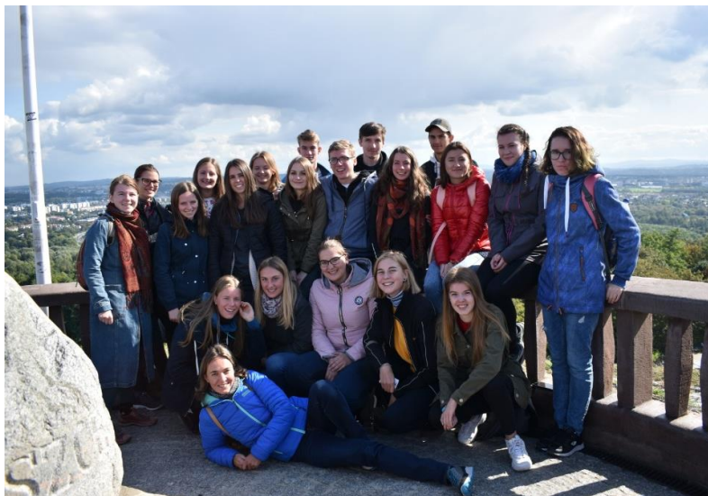
4. C na vrcholu Kościuszkovy mohly.