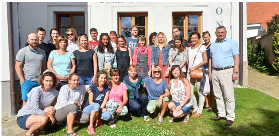
Pedagogický sbor v Hnaničich.