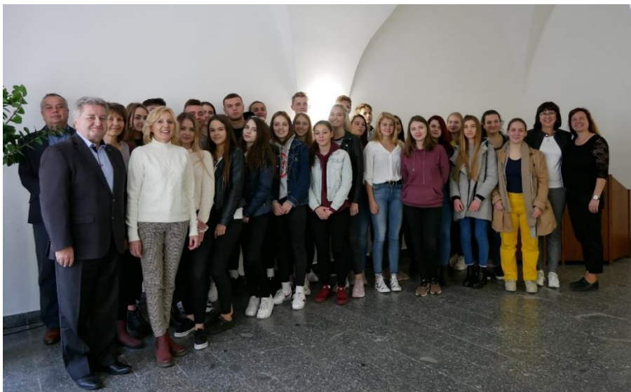
Přijetí účastníků výměny představiteli města Velké Meziříčí.

Závěrem bychom chtěli poděkovat městu Velké Meziříčí a Sdružení rodičů při GVM za finanční podporu, díky níž jsme mohli výměnu realizovat, dále pak vedení školy a všem zúčastněným pedagogům za investování času, síly a nápadů, bez kterých bychom to nezvládli.