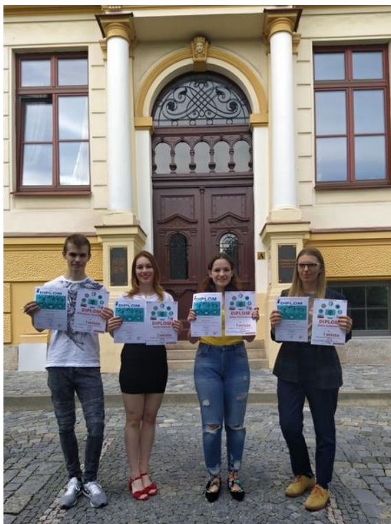
Naši úspěšní žáci v soutěži SOČ.