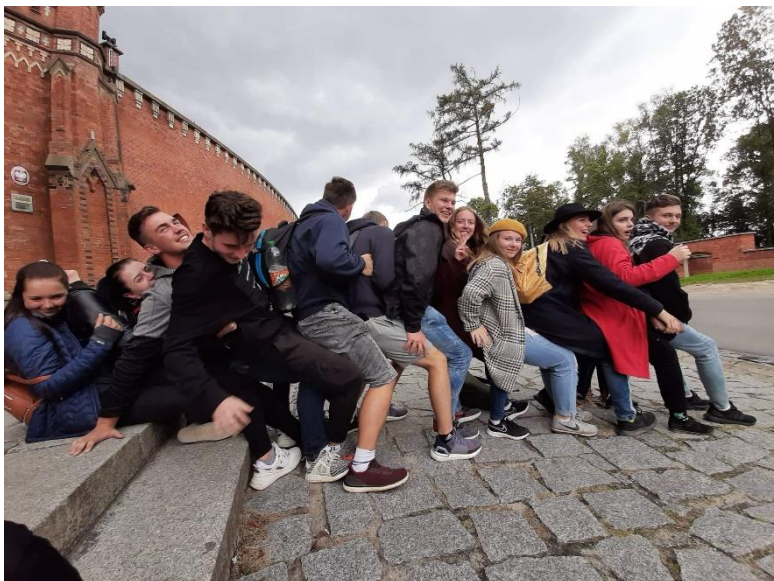
8. A při čekání na autobus pod mohylou T. Kościuszka v Krakově.