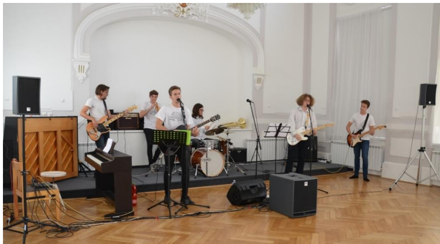
Naše hudební skupina MHD.