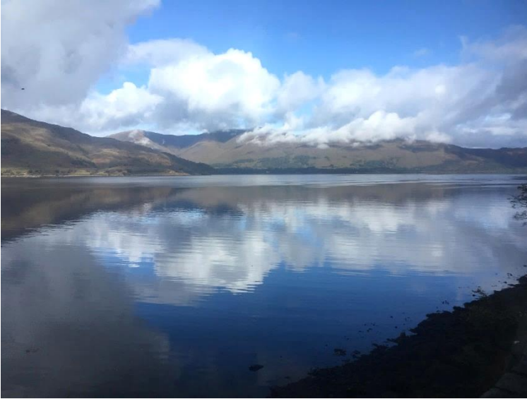
Scottish Highlands, pohled z autobusu.