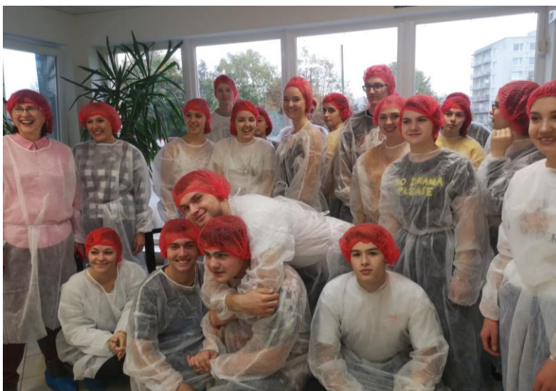
Exkurze ve firmě Poex.