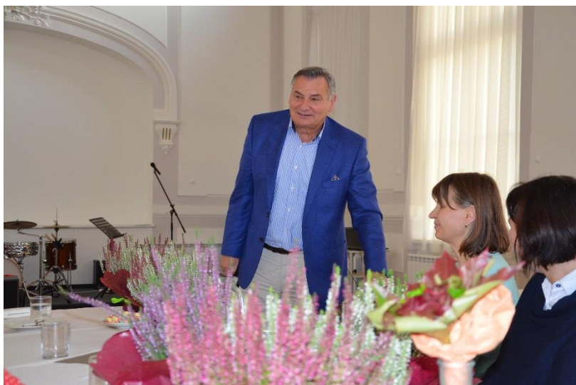
Ředitel GVM se loučí s návštěvou.