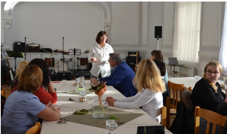
Ředitelka partnerské školy hodnotí pobyt.