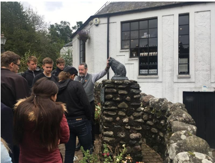
Glenturret Distillery a Towser the mouser.