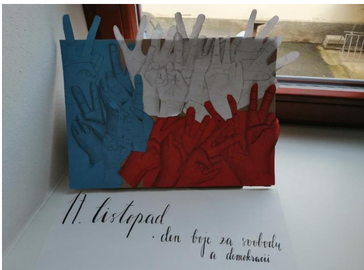
Výtvarná práce žáků 6. A.