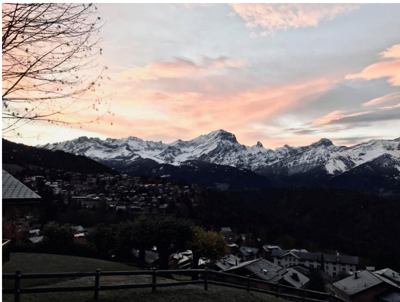
Výhled z chaty – není to krása?