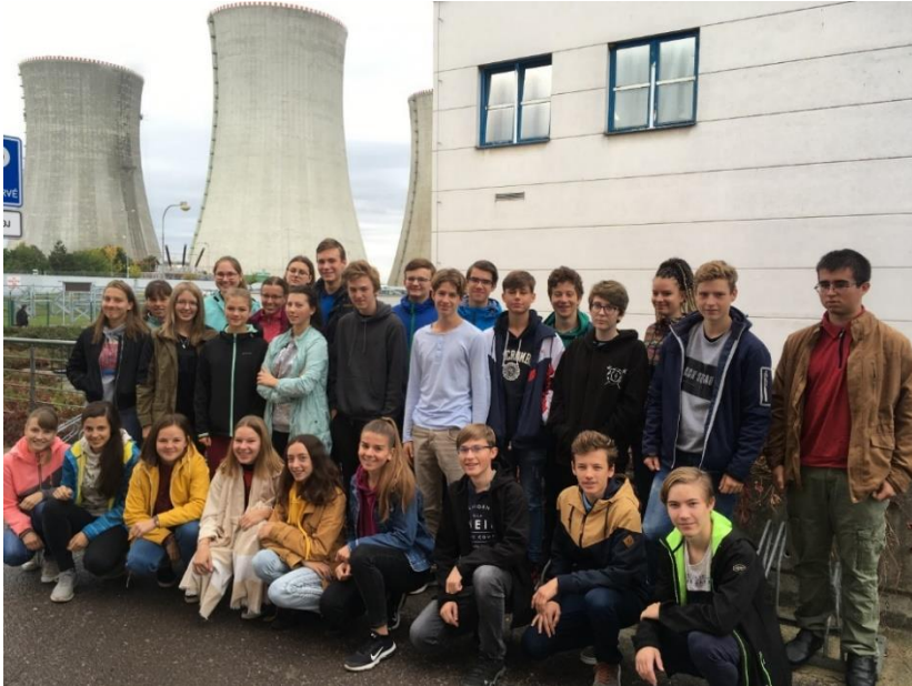
Účastníci exkurze v Dukovanech.