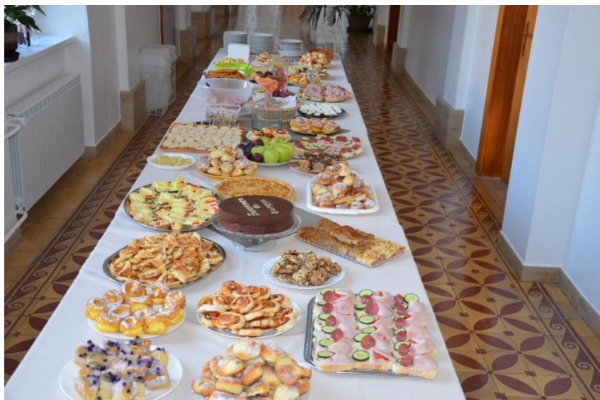
Občerstvení zhotovené rodinami českých účastníků výměny.