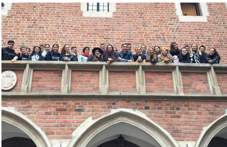
8. A na ochozu Jagellonské univerzity v Krakově.