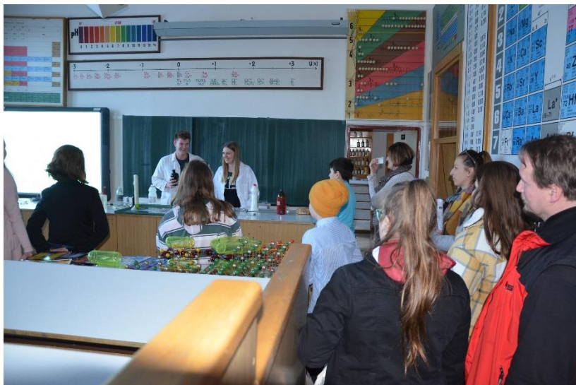
Odpoledne otevřených dveří.