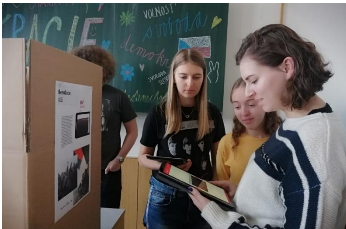
Interaktivní výstava Střípky revoluce v laboratoři fyziky.