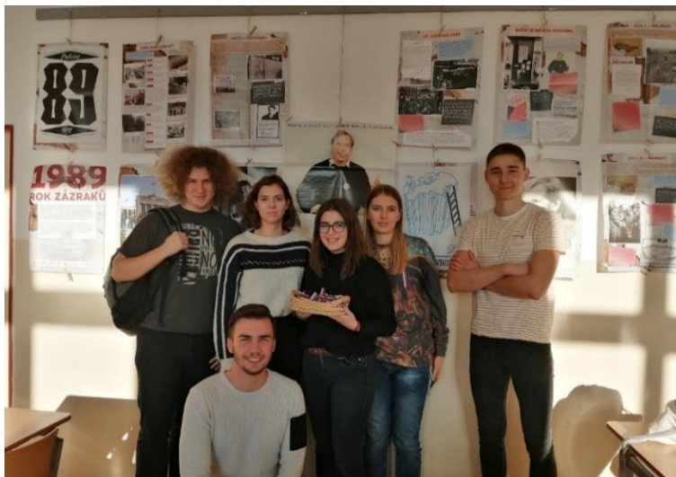
Část organizačního týmu akce.