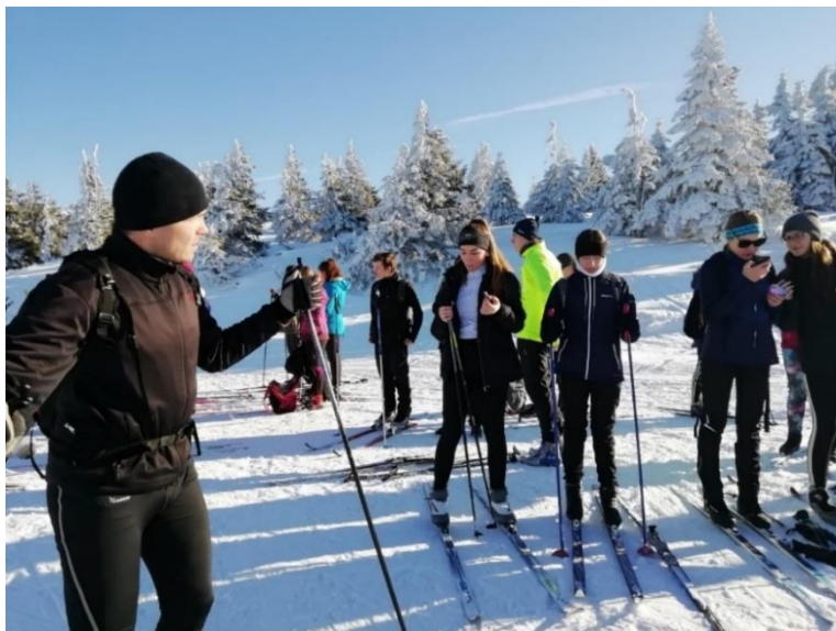
Výjezd na běžkách.