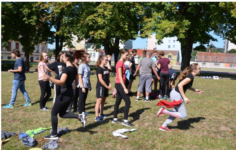
Žáci 1. C při adaptačním dopoledni.

Dalšímu vzdělávání pedagogických pracovníků (DVVP) věnujeme pozornost, neboť přispívá ke zkvalitnění výuky a práce se žáky. Při sestavování plánu se přihlíží k potřebě DVVP, aktuální nabídce a také k efektivnímu využití finančních prostředků, které jsou na DVVP vynaloženy. Skutečnost se oproti plánu může mírně lišit. Podporujeme nejrůznější formy: doktorské studium, semináře a školení k nové maturitě, krátkodobé kurzy z různých předmětů apod. Další vzdělávací aktivity jsou realizovány v rámci grantu Šablony na GVM a prostřednictvím krajského projektu Učíme se ze života pro život. Vedení školy sestavuje plán DVVP a vede přehled všech kurzů absolvovaných jednotlivými učiteli. Tyto materiály jsou uloženy na ředitelství školy.