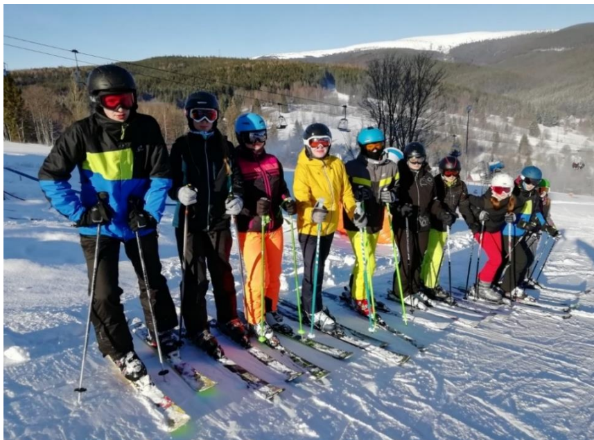
Žáci při výcviku sjezdového lyžování.

Ve čtvrtek dopoledne jsme naposledy sjeli kopec a odpoledne se šlo na běžky. Autobusem jsme vyjeli na Ovčárnu a odtud už na lyžích pokračovali na Praděd, kde jsme měli krásné počasí. Mohli jsme odsud vidět například masiv Mravenečník s vodní elektrárnou Dlouhé stráně. Ve čtvrtek jsme se s lyžákem rozloučili, měli jsme společenský večer s kapelou Kentaur, což byla „magie“. V pátek ráno jsme se sbalili a během odpoledne jsme se vrátili ke gymnáziu. Všichni jsme si kurz moc užili. Byl to týden plný zábavy, pěkného počasí a spousty sněhu. Děkujeme profesorům, kteří nás na kurzu vedli a učili novým dovednostem.