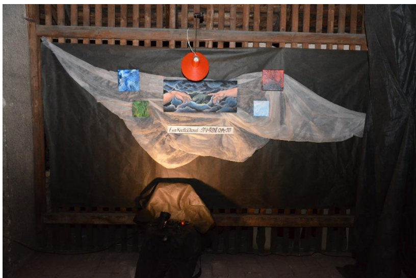
Z výstavy výtvarných maturitních prací na půdě GVM.