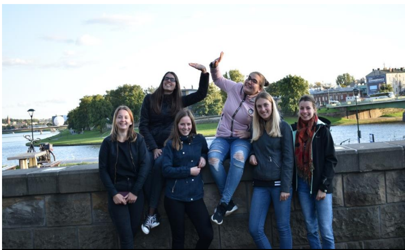
Část 4. C při čekání na autobus na nábřeží Wisly v Krakově.