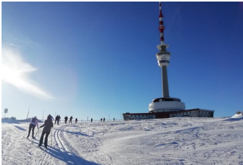
Cesta na běžkách na Praděd.