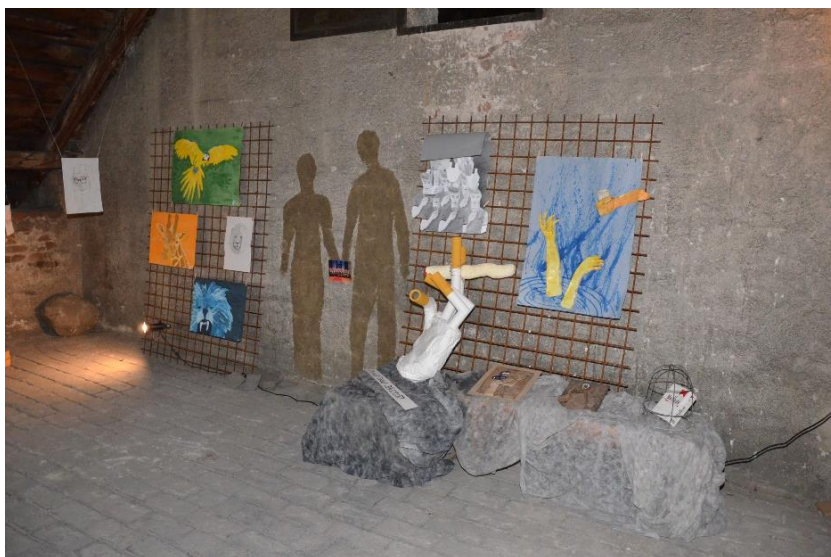
Z výstavy maturitních prací na půdě GVM.

Prevence sociálně patologických jevů vychází z Minimálního preventivního programu , který je sestavován pro daný školní rok. Ten obsahuje zvolenou strategii a postup při prevenci u žáků naší školy. Základním principem je výchova ke zdravému životnímu stylu, výchova k osvojení si vhodného sociálního chování a vedení k zodpovědnému jednání každého žáka. V Minimálním preventivním programu jsou uvedeny nejen jednotlivé kroky, ale i konkrétní aktivity (přednášky, besedy, sportovní akce apod.), které jsou v daném školním roce realizovány.