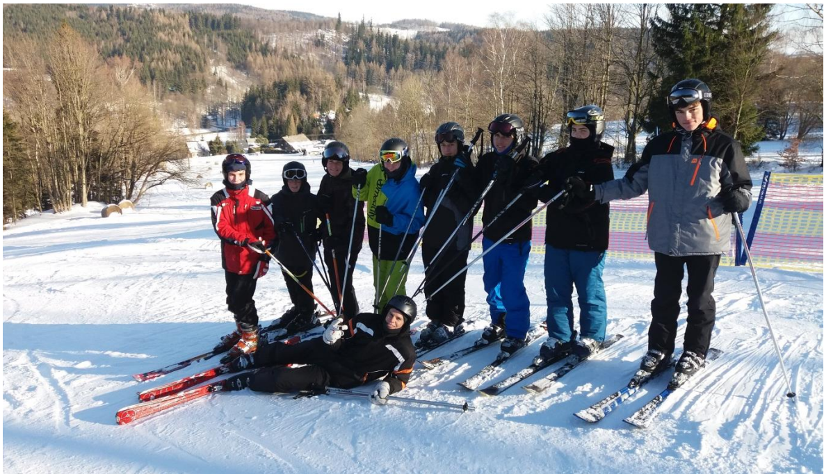
Po výcviku sjezdového lyžování.