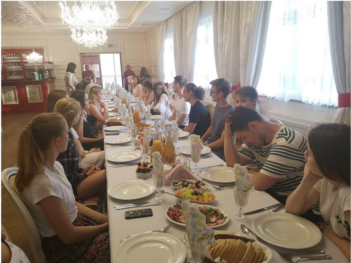
Uvítací večere v tomaszówské restauraci