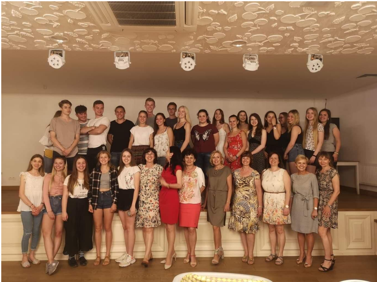
Účastníci výměny spolu s učiteli