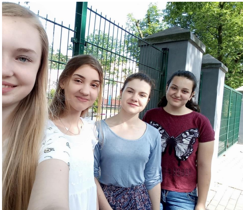
Studentky z Čech a Polska