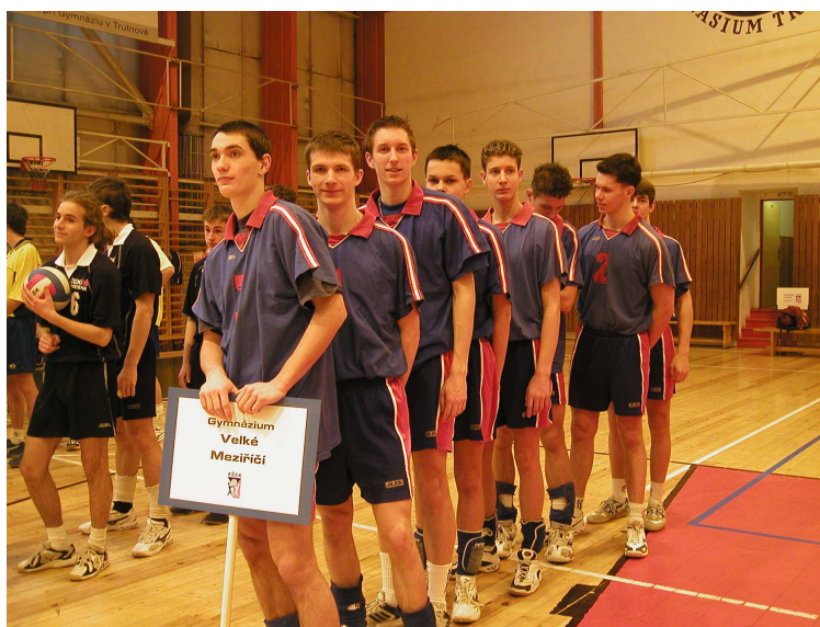
Družstvo našich volejbalistů.